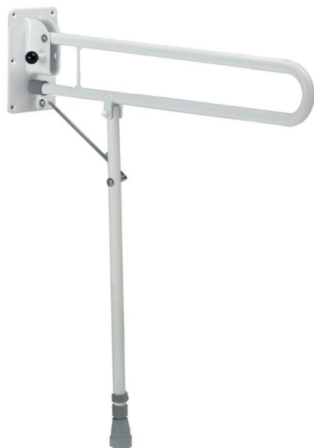
Zobrazený model: 4231

Délka ramene: 69 cm Velikost držáku na stěnu: 20x13 cm Max. hmotnost uživatele: 115 kg