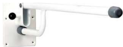
Zobrazený model: 4232

Délka ramene: 69 cm Velikost držáku na stěnu: 20x13 cm Max. hmotnost uživatele: 115 kg