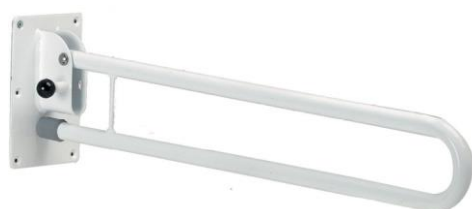
Zobrazený model: 4230

Délka ramene: 69 cm Velikost držáku na stěnu: 20x13 cm Max. hmotnost uživatele: 115 kg