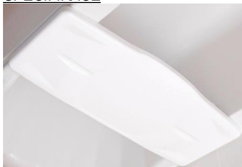
Zobrazený model: 4806/4807

Hloubka: 28 cm Tloušťka: 3 cm 4806 Šířka: 67 cm 4807 Šířka: 71 cm