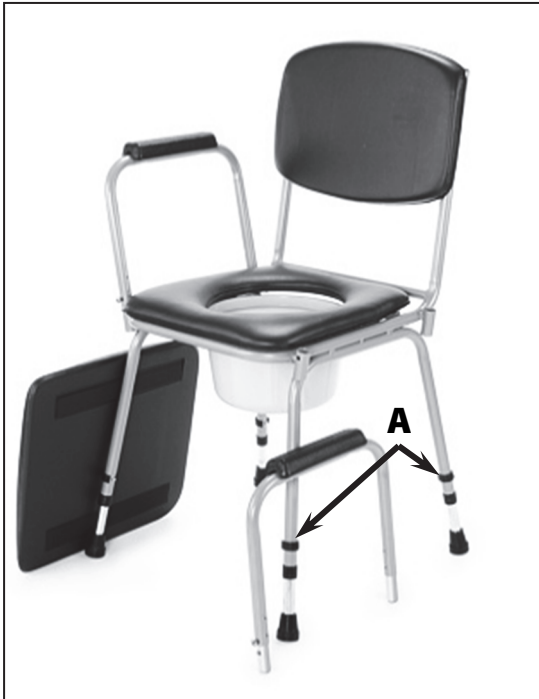
Umístění aretačních pojistek