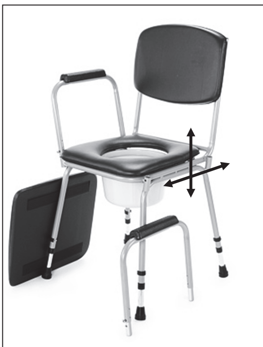
Vysunutí/zasunutí plastové nádoby

Pro použití křesla sundejte polstrovaný sedák a odstraňte víko plastové nádoby. Nádobu pak lze vysunout z držáků pod hygienickým prkénkem dozadu nebo vyjmout po odklopení prkénka horem. Po zmáčknutí pojistky (B) tahem nahoru velmi jednoduše vysunout madlo s područkou pro lepší nasedání.