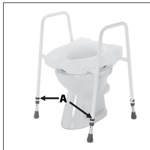
Umístění aretačních pojistek

V případě nutnosti odstranění závady nebo provedení servisu, kontaktujte autorizovaného prodejce, který Vám poskytne veškeré informace.