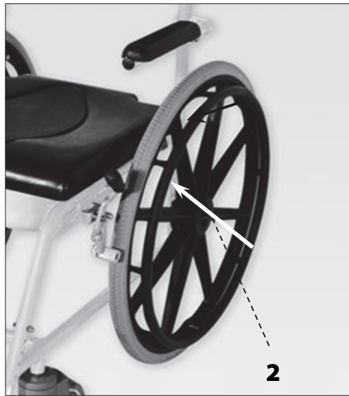
Připevnění zadních kol